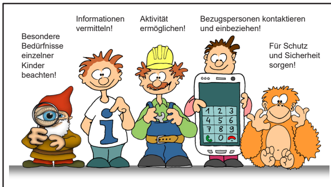
Abb. 2: Merkfiguren zur Psychischen Ersten Hilfe (nach Karutz 2015)

Ein bereits vor einigen Jahren entwickeltes Konzept zur Psychischen Ersten Hilfe für Kinder (Karutz 2015) konnte mit den Ergebnissen der Befragung in seinen Kernaussagen bzw. Handlungsempfehlungen zunächst einmal empirisch bestätigt werden (Abb. 2). Demnach sollte eine Akutversorgung auf jeden Fall folgende fünf Aspekte beinhalten: