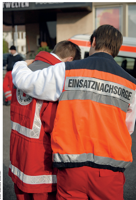
Einsatznachsorge findet im Zeitraum von Tagen bis wenigen Wochen nach einem Einsatzende statt und beinhaltet beispielsweise Einzelberatungs- und Gruppennachsorgegespräche.

werden. Mit psychosozialen Akuthilfen soll der Entwicklung negativer Belastungsfolgen systematisch entgegengewirkt werden. Zu den psychosozialen Akuthilfen gehört unter anderem auch eine Bedürfnis- und Bedarfserhebung sowie die Vermittlung von Betroffenen an Anbieter weiterführender psychosozialer Hilfen.