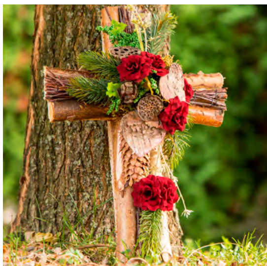
Abb. 3: Wo und wie möchte man eigentlich bestattet werden? Auch darüber kann man durchaus einmal nachdenken!

Die verschriftlichten Überlegungen für den Fall des eigenen Todes sollten regelmäßig überprüft und aktualisiert werden, z. B. einmal im Jahr an einem bestimmten Datum. Wenn man generell gern über den eigenen Tod nachdenken und auch einige Vorbereitungen treffen möchte, sich dazu – warum auch immer – allein aber nicht in der Lage sieht, sollte Unterstützung in Anspruch genommen werden.