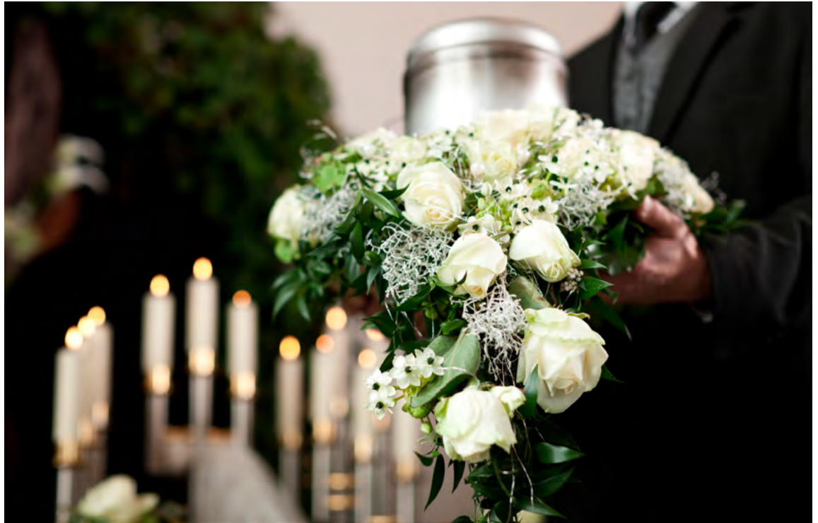
Abb. 1: Konkrete Wünsche für die eigene Trauerfeier anzugeben, kann für Angehörige eines Tages hilfreich und entlastend sein.